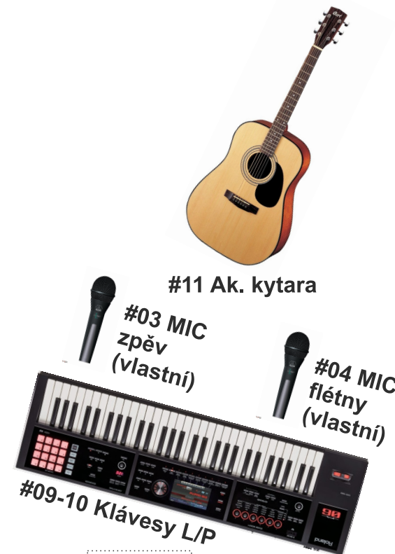
#11 Ak. kytara