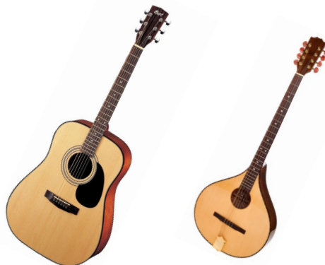
#07 Ak. kytara #08 Bouzouki